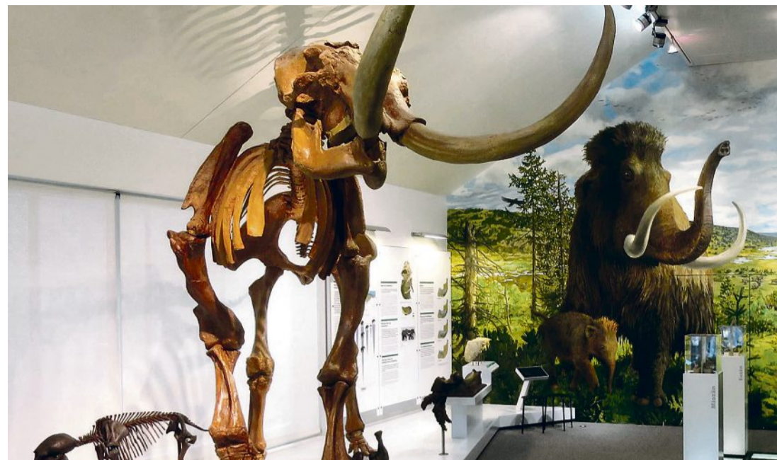
Skelettrekonstruktion im Mammutmuseum

Wem Käfer und Schmetterlinge zu klein sind, der stattet dem Mammutmuseum in Niederweningen einen Besuch ab. In der reichhaltigsten Mammutfundstätte der Schweiz sind bis heute zehn Mammutteile ausgegraben worden, darunter ein junges Mammutkalb. Dessen Skelettrekonstruktion ist weltweit einzigartig. Dank der Mammutfundsicht und den Ablagerungen im ehemaligen Gletschersee des Wehntals kann die Klimageschichte der letzten 50 000 Jahre aufgezeigt werden. Das «tierische Vergnügen» kann optimal mit einer Wanderung durch das Wehntal kombiniert werden. Ab Steinmaur wandert man über weites Landwirtschaftsgebiet in etwa zwei Stunden zum Museum.