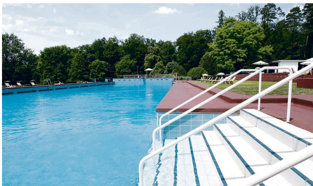
Dolder Bad auf dem Adlisberg