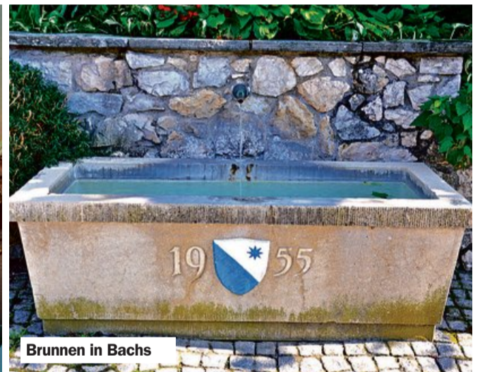
Brunnen in Bachs